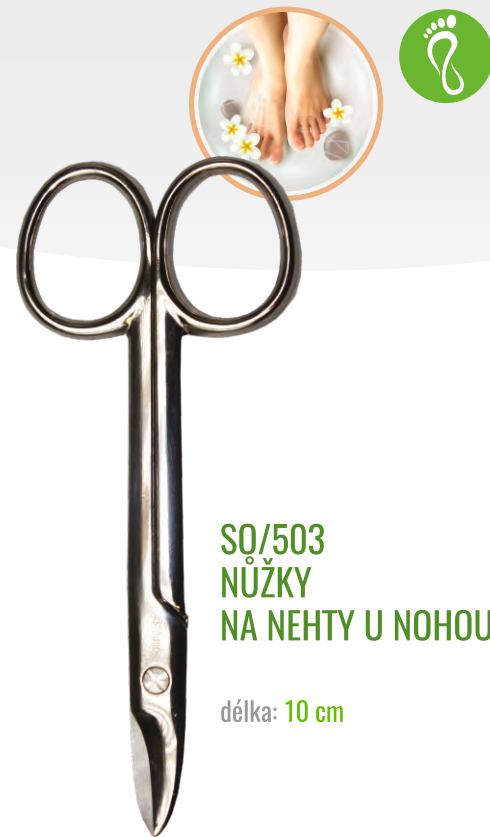
SQ/503 NŮŽKY NA NEHTY U NOHOU