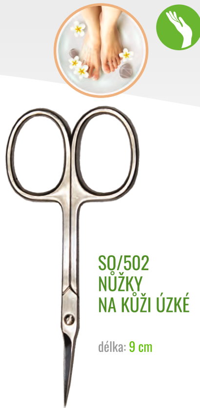
SQ/502 NŮŽKY NA KŮŽI ÚZKÉ