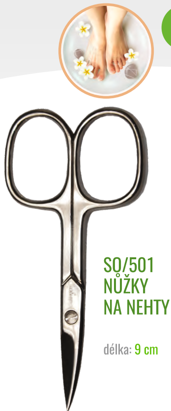
SQ/501 NŮŽKY NA NEHTY